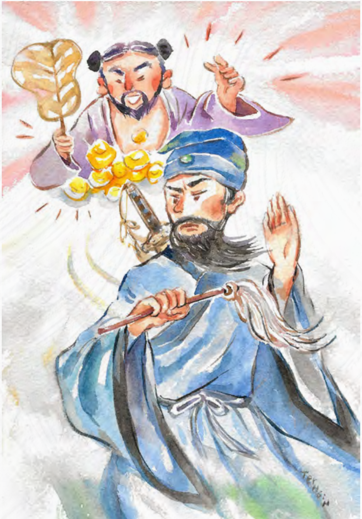
恭錄自 蔡禮旭老師《小故事大智慧》